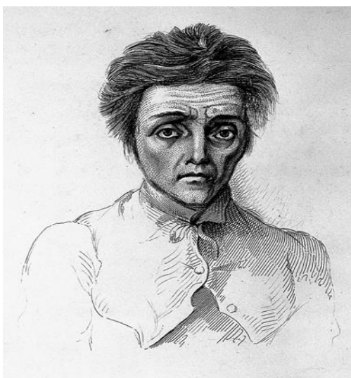
شكل (٢): تمثال نصفي للامبراطور الروماني ترايانوس ديكيوس تعكس حالة القلق