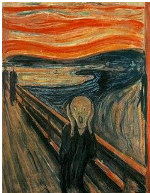
شكل (١) لوحة الصرخة لشخص تجسد الفزع والخوف (الفنان النرويجي إدفارت مونك ، ١٨٩٣)